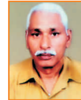
Manphoolram Karagwal Shri Ganganagar